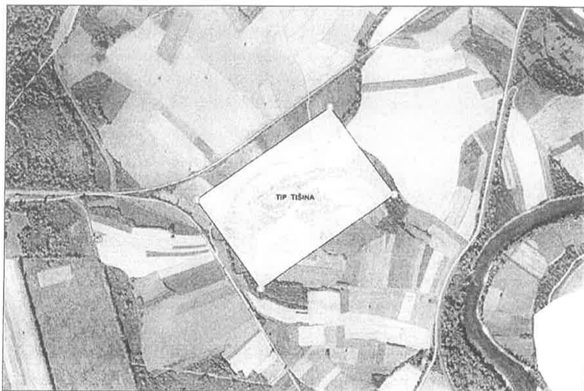
Grafički prikaz traženog istražnog prostora građevnog pijeska i šljunka "Tišina"